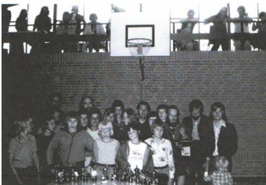
Clubkampioenen rond de prijzentafel

Een eerste bestuursactiviteit was het wedstrijdsecretariaat senioren, maar dat heeft geloof ik maar één jaar geduurd.