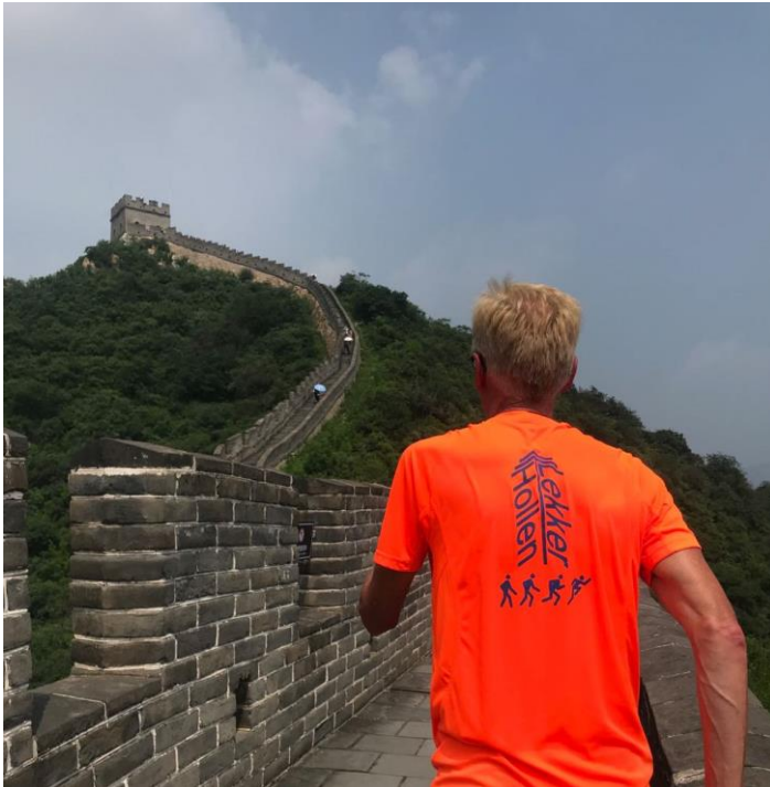
Hardlopen op vakantie is altijd leuk