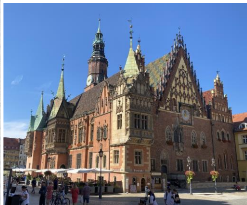
In de vakanties vind ik het leuk om de oude gebouwen op de postzegels in het echt te zoeken