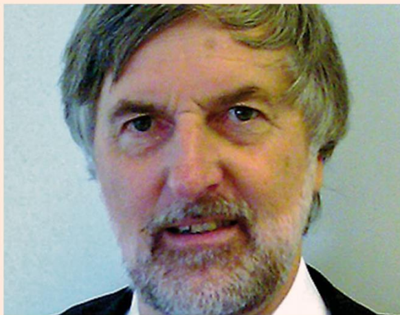
Voorspellende bijdrage van Emiel in het FD in 2010